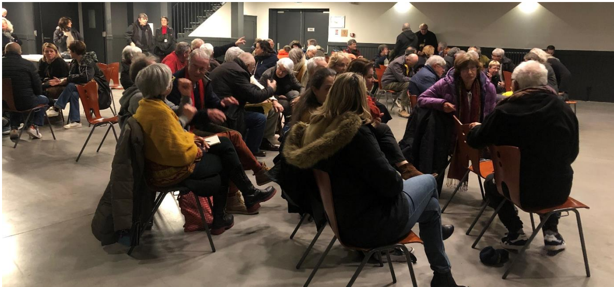
Les participants discutent avec leurs voisins de leurs impressions sur les présentations.