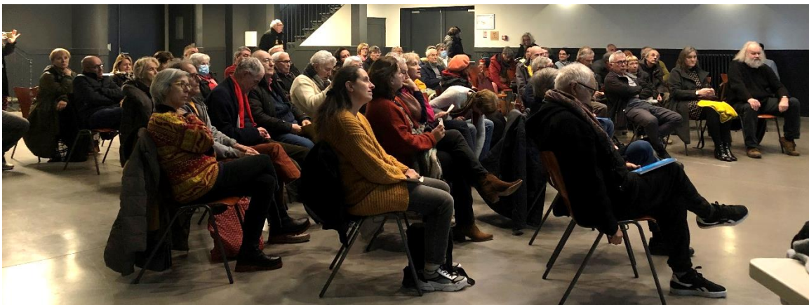
Présentation des études techniques, réunion publique d'information du 7 février 2023 à Pézenas. Lisode, 2023

La présentation complète est jointe en annexe à ce compte-rendu.