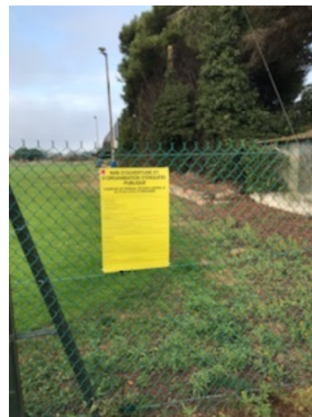
St Christol - Stade Trigit