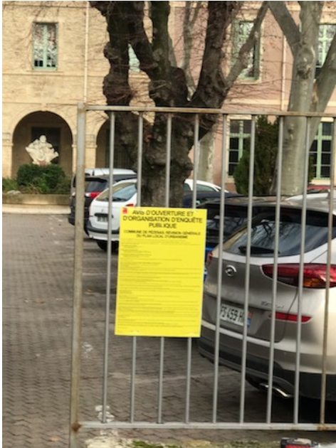
Hôtel de Ville-Parking B. Lapointe