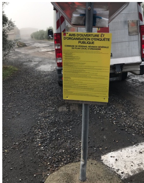
St Martin Bonne Terre